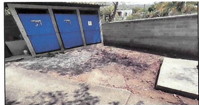
Foto 6: Instalación de estructura metalica y deposito de agua, torta de cemento rustico y construcción de pila de dos lavaderos.

Observación: Si es necesario se pueden agregar hojas adicionales y actualizar el número de hojas.