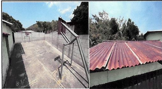
Foto 1: Instalación de galera con su estructura metalica y lamina troquelada, instalación de techado en cocina con su estructura metalica y lamina troquelada