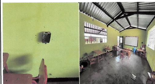
Foto 5: Instalación de toma corrientes, plafoneras y bombillas ahorradoras.