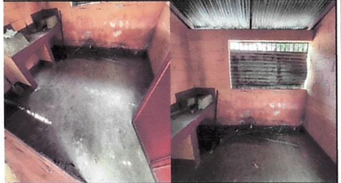
Foto 2: Instalación de estufa rural con su respectivo azulejo en el poyeton asi mismo alargado del cimiento de la estructura de la estufa, construcción de mueble de cocina con sus respectivas puertas de PVC y