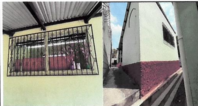
Foto 3: Mantenimiento a balcones (lijado, Pintado e instalación de su respectivo mosquitero de plastico) y pintura general en los muros interiores y exteriores de la escuela